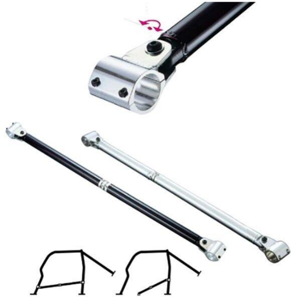
الصورة رقم 6