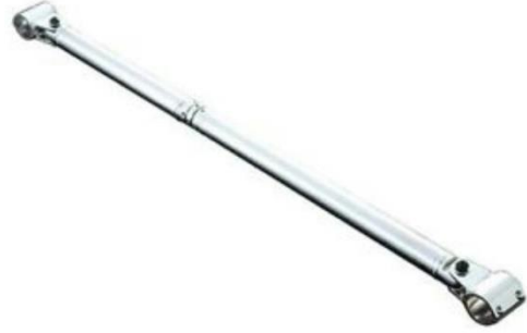
الصورة رقم 4