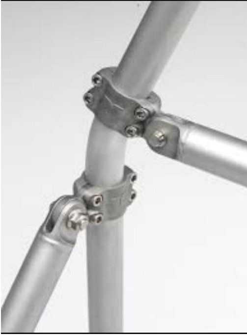
الصورة رقم 3