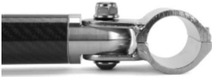
الصورة رقم 5